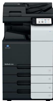
bizhub i-Series C360i