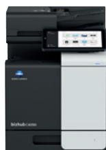
bizhub i-Series C4050i

A medida que su negocio crece, también nosotros crecemos con usted, conectando a la perfección a personas y lugares que aportan una nueva dimensión a su flujo de trabajo documental y la gestión de su seguridad.