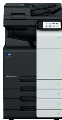
bizhub i-Series C360i